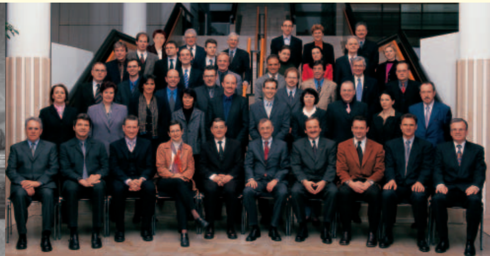
Der XXVII. Vorarlberger Landtag 2001.