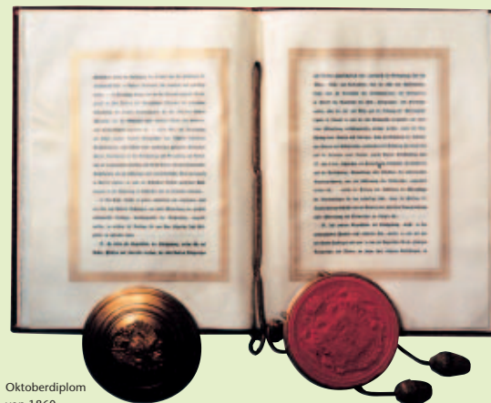
Oktoberdiplom von 1860.

Die Hauptaufgaben der Landstände lagen auf dem Gebiet des Steuerwesens und der Landesverteidigung. Seit ihrer frühesten Zeit kämpften die Stände auch um mehr Rechte für ihr Heimatland und gegen Versuche der Zentrale, Teile Vorarlbergs zu verpfänden oder gar zu veräußern. So verhinderten die Landstände 1620 die Errichtung eines emsischen Landesfürstentums in Vorarlberg oder im Jahre 1702 den Verkauf des Landes an den St. Galler Klosterstaat.