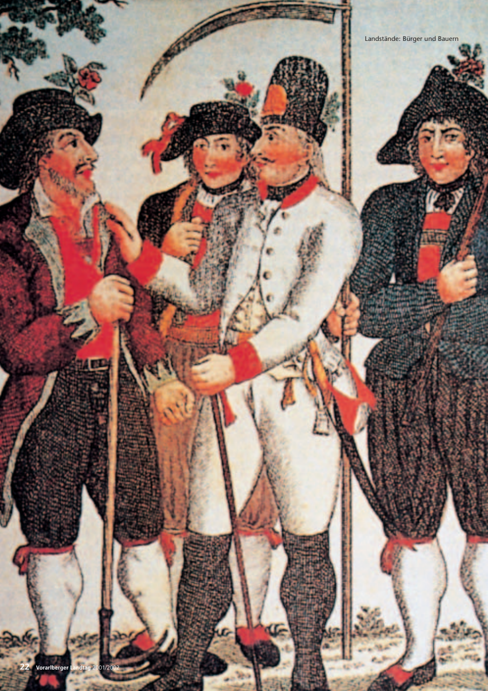
Landstände: Bürger und Bauern