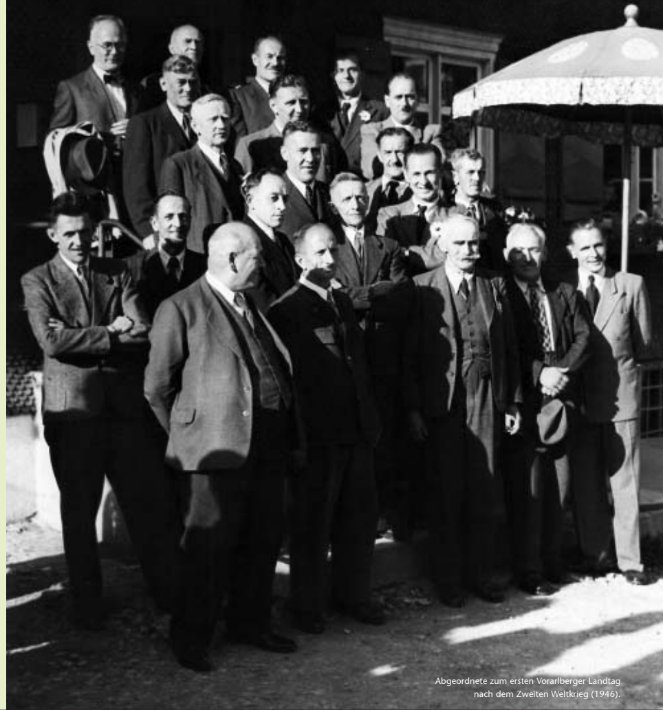
Abgeordnete zum ersten Vorarlberger Landtag nach dem Zweiten Weltkrieg (1946).

Die schwierigen politischen und wirtschaftlichen Verhältnisse in Österreich führten zum vorläufigen Ende der jungen Demokratie. Der Übergang von der demokratischen Republik zum Ständestaat brachte Vorarlberg an Stelle eines vom Volk gewählten einen vom Landeshauptmann nach berufsständischen Grundlagen ernannten Landtag.