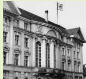
Von 1923–1981 tagte der Landtag in der Montfortstraße in Bregenz (jetzt Hypo-Bank)