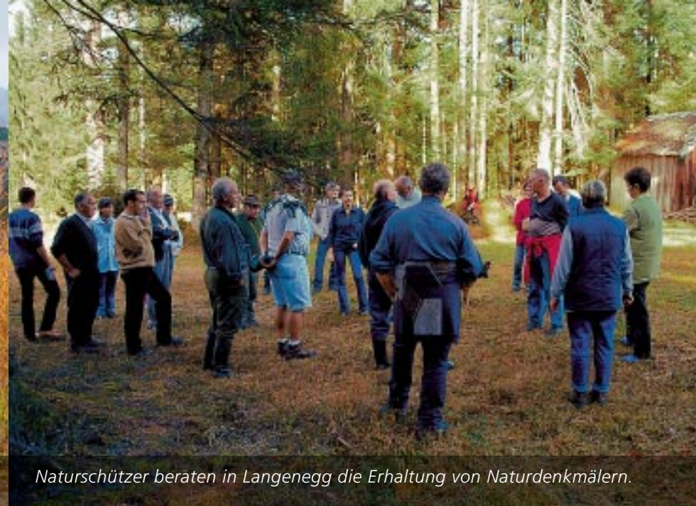
Naturschützer beraten in Langenegg die Erhaltung von Naturdenkmälern.