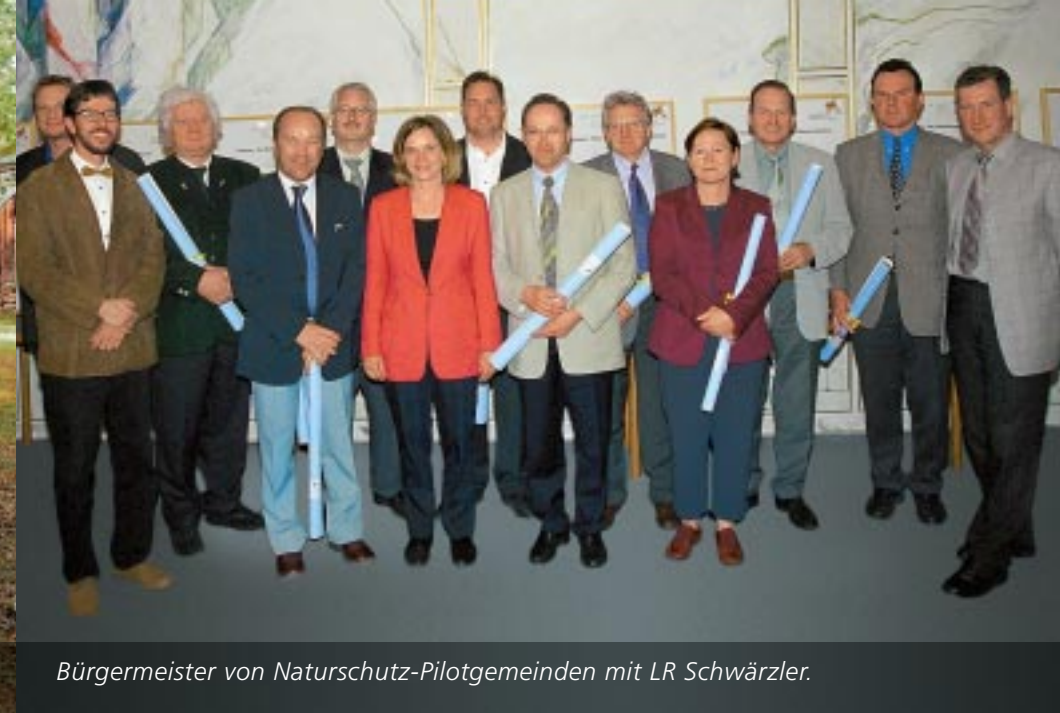
Bürgermeister von Naturschutz-Pilotgemeinden mit LR Schwärzler.