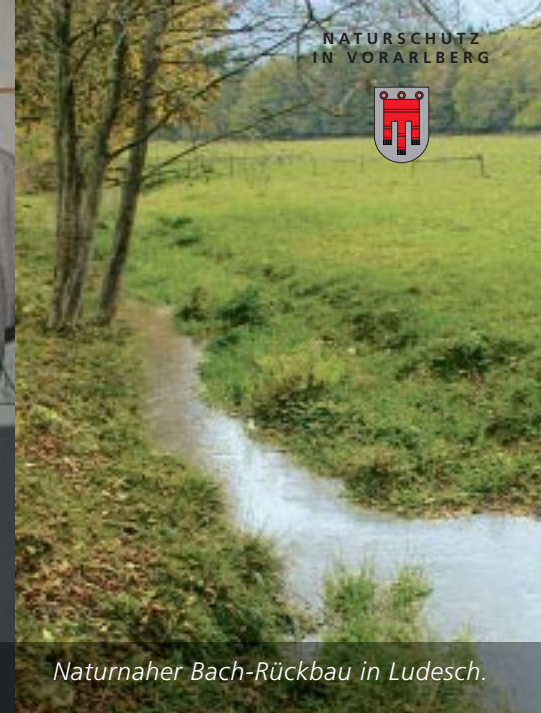
Naturnaher Bach-Rückbau in Ludesch.