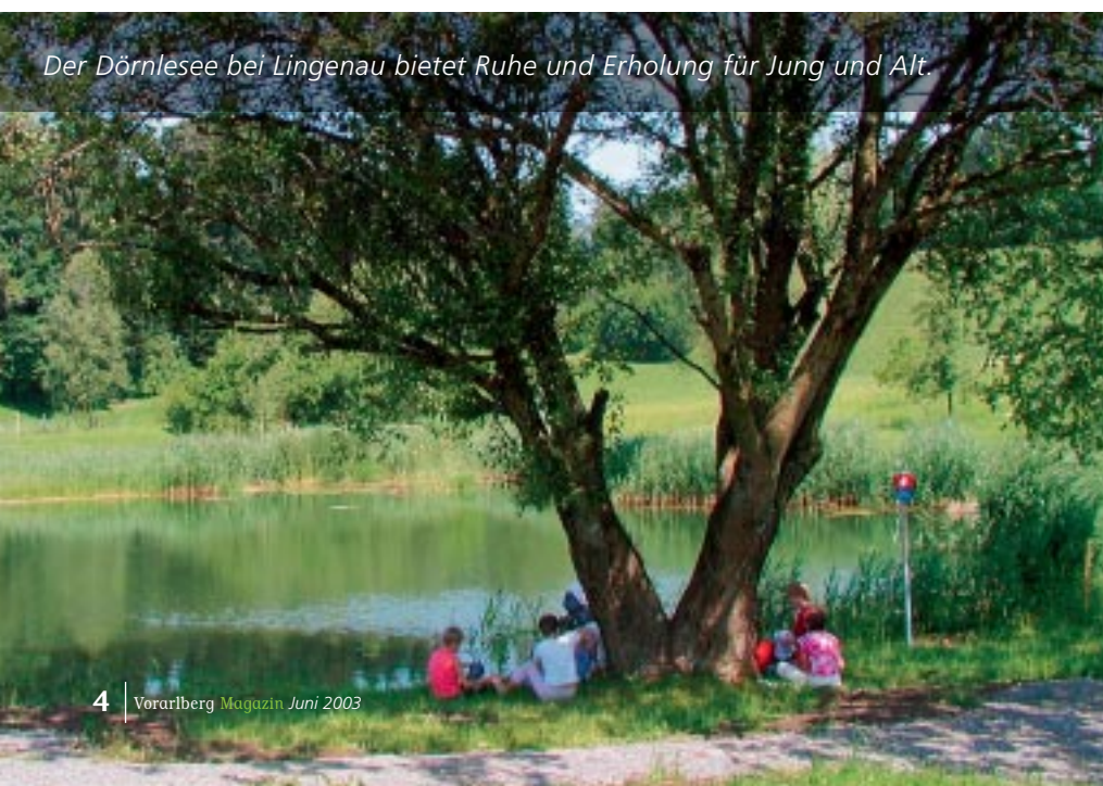
Der Dörnlesee bei Lingenau bietet Ruhe und Erholung für Jung und Alt.

Amt der Vorarlberger Landesregierung Abteilung Umweltschutz Landhaus Römerstraße 15, A-6901 Bregenz • T +43(0)5574/511-24505 • F +43(0)5574/511-924595 • E umwelt@vorarlberg.at • I www.vorarlberg.at/umwelt