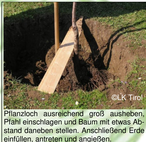
Pflanzloch ausreichend groß ausheben, Pfahl einschlagen und Baum mit etwas Abstand daneben stellen. Anschließend Erde einfüllen, antreten und angießen.