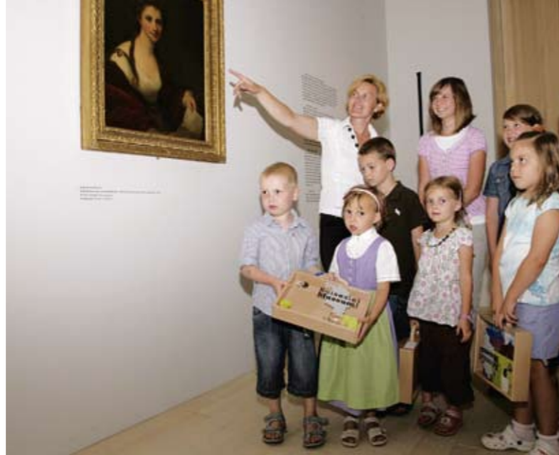
„Reiseziel Museum!“: Angelika Kauffmann Museum, Schwarzenberg.