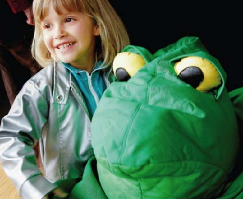
„Sonntags bei Gosch“: Jeden Sonntag um 15 Uhr Theater für Kinder ab 6 Jahren im Landestheater in Bregenz.