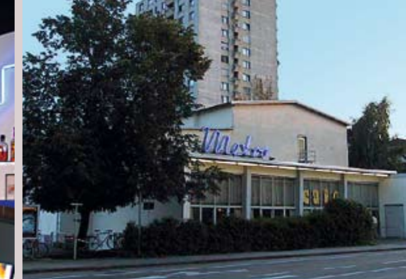
Metro Kino Bregenz, ältestes Kino Vorarlbergs