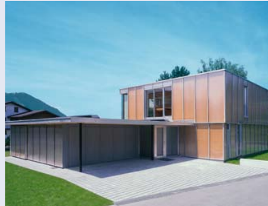
Haus W., Sateins, Arch. Walter Unterrainer

Über 40.000 Personen allein in Frankreich haben die Ausstellung des Französischen und des Vorarlberger Architektur Instituts in 27 Städten besucht.