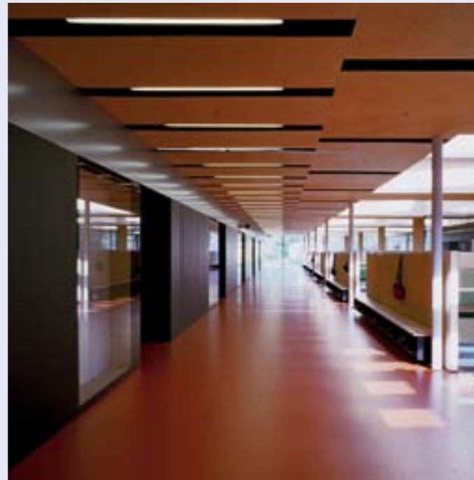
Hauptschule Klaus Weiler Fraxern, Arch. Dietrich/Untertrifaller