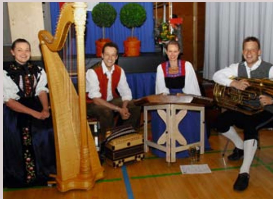
„Die flotten Dreiviertler“

Dieser Eindruck dränge sich immer wieder auf. Nirgendwo sonst sei sie beim Gespräch mit Eingesessenen so einem dichten Netz an Landeskenntnissen, Verwandtschaften, Verflechtungen aller Art begegnet wie hier: Jedermann schien fast zu jedermann einen Faden zu knüpfen, ein Beziehungsfeld anreißen zu können.