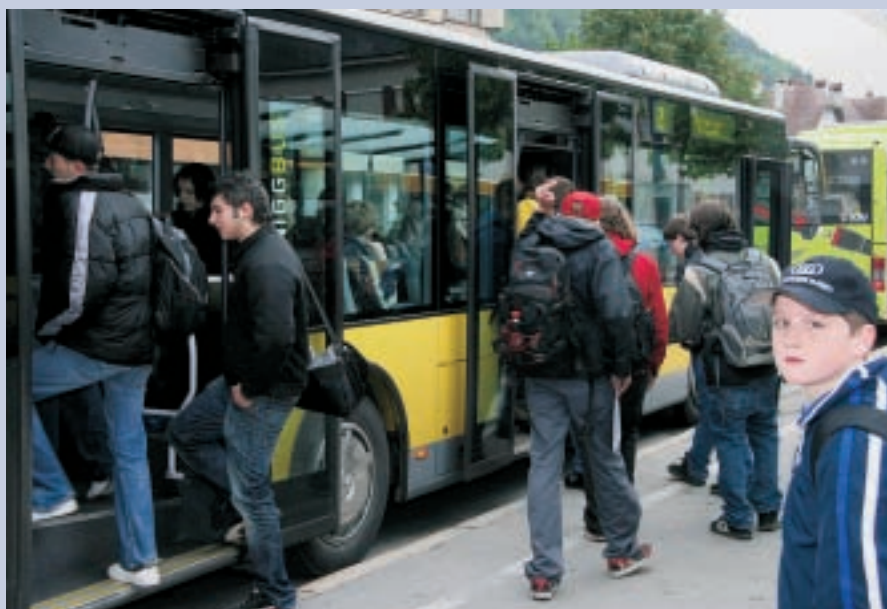
Verkehrsverbund: 300 Busse sorgen für gute Verbindungen.

Das neue Konzept konzentriert sich auf den Handlungsspielraum des Landes, enthält aber auch Forderungen an die übergeordnete und nachbarschaftliche