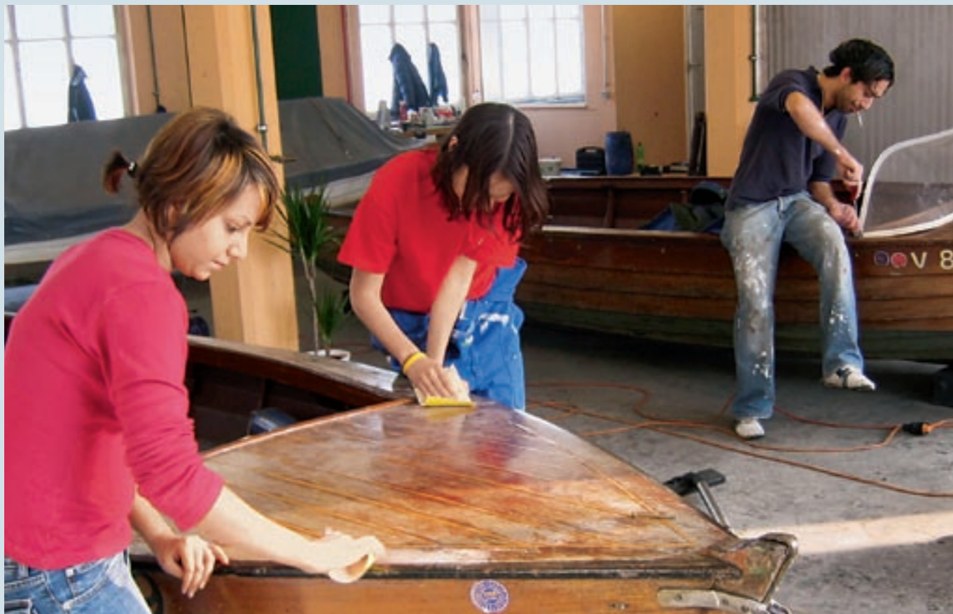
Bei JOB AHOI ! lernen die jungen Menschen mit Schleifgerät und Bohrmaschine umzugehen.