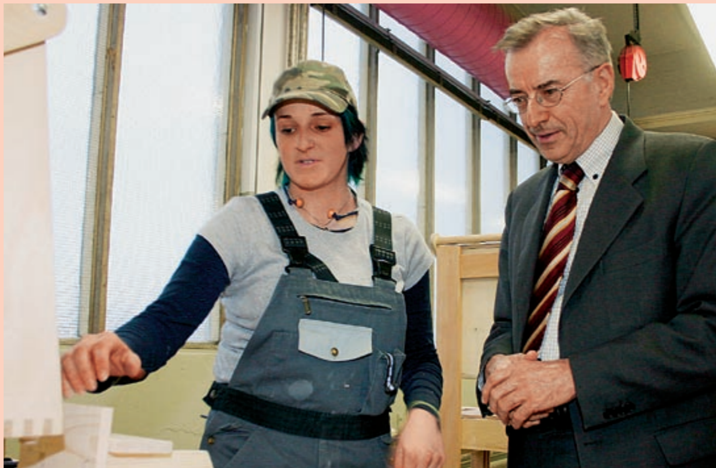
Landeshauptmann Herbert Sausgruber zu Besuch im überbetrieblichen Ausbildungszentrum in Hohenems: „Die Praktikerlehre bietet ein Auffangnetz und eine Perspektive für junge Menschen.“

Landhaus, 6. Stock, Zimmer 603 Römerstraße 15, 6901 Bregenz • T +43(0)5574/511-20005 • F +43(0)5574/511-20090 • E landeshauptmann@vorarlberg.at • I www.vorarlberg.at/lh