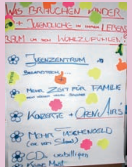
Forderungen zum Thema „Freizeit“ in Dornbirn.