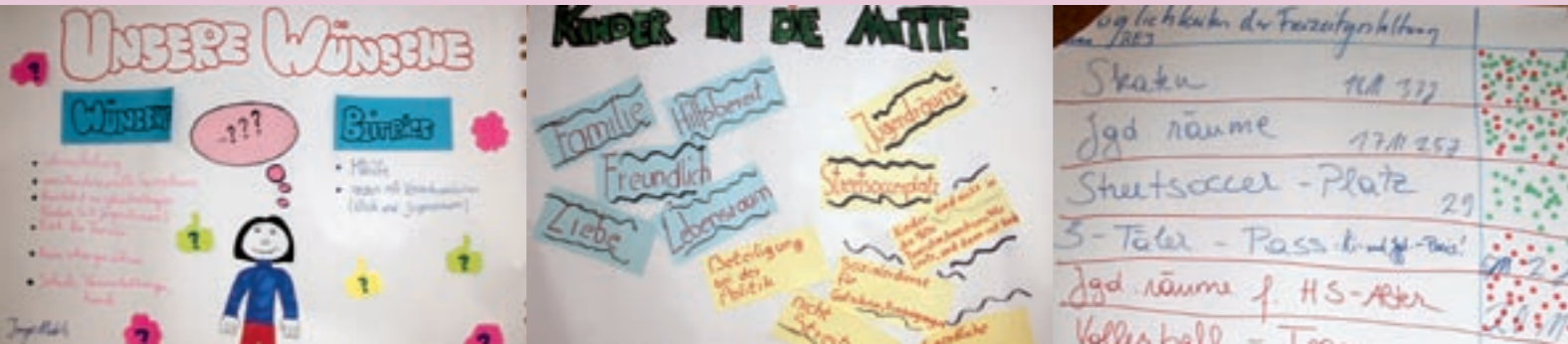
Die Bezauer Schülerinnen und Schüler ... zeigen vor allem eines: den Wunsch ... nach mehr Freizeitangebot.

Für die Verantwortlichen von „Kinder in die Mitte“ war von Anfang an klar, dass neben Expertinnen und Experten auch Kinder- und Jugendliche eingebunden werden müssen. Zu diesem Zweck wurden mehrere Zukunftswerkstätten organisiert, die im November und Dezember 2004 in Dornbirn und Bezau stattgefunden haben.