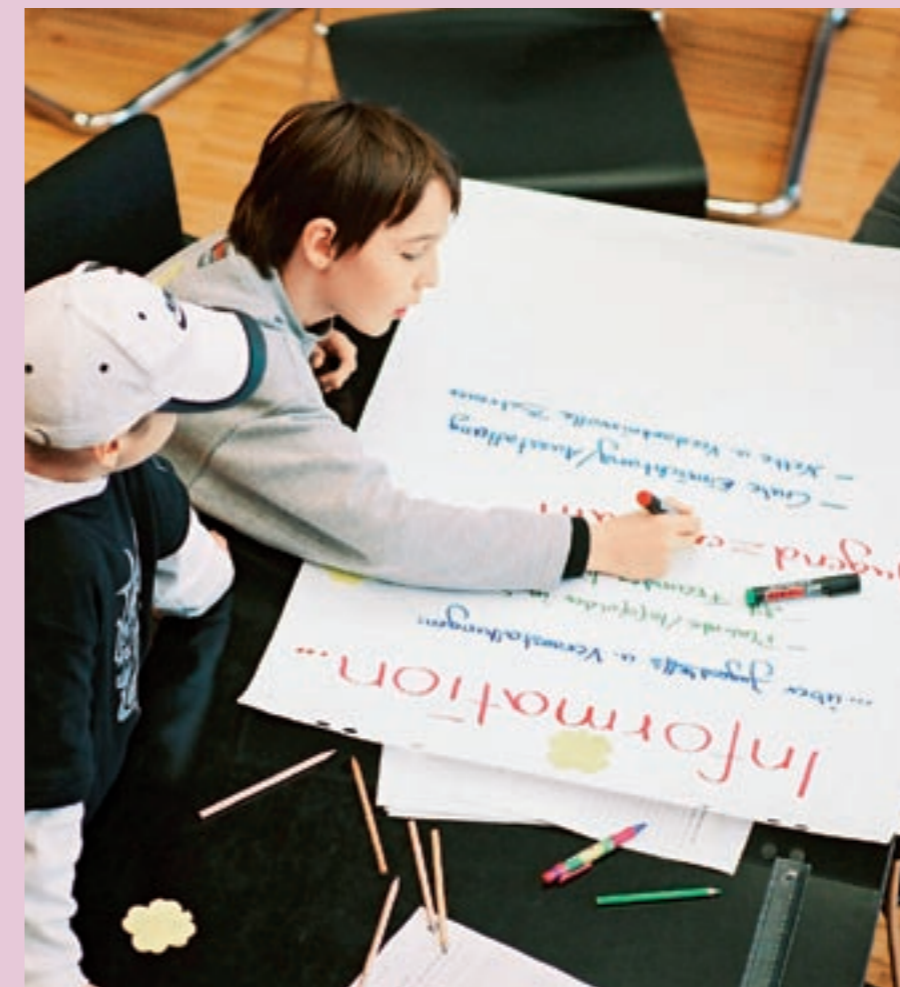
In Kleingruppen wurden Plakate gestaltet.

Die positive Veranstaltungsbeurteilung, verbunden mit dem geäußerten Wunsch nach mehr Beteiligung und der Bereitschaft, sich für die Umsetzung der eigenen Ideen zu engagieren, sollte als Anregung dienen, Kindern und Jugendlichen öfter die Chance zu bieten, ihre Meinung einzubringen.