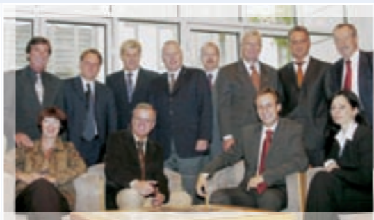
Landtagsriege der FPÖ