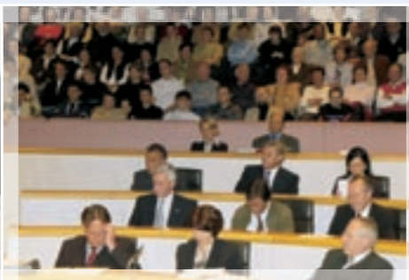
Blick über die FPÖ-Fraktion zur Galerie