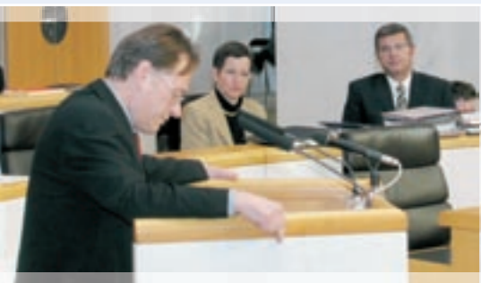
KO Hagen am Rednerpult