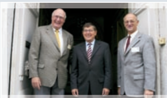
LTP Dörler zu Gast in Eupen/Belgien