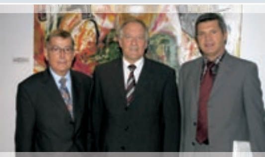
LTP Dörler mit LTP Straub und LR Stermer

Auf der Homepage des Landtages finden sich neben den Terminen und der Tagesordnung von Landtagssitzungen Informationen zu den Abgeordneten und Ausschüssen, über den Bundes- und Nationalrat, die Landesgesetze, den Landesvolksanwalt und den Landes-Rechnungshof, die Landtagsklubs, zu Wahlen und Mandatsverteilung sowie über die Geschichte des Landtages und der parlamentarischen Demokratie in Vorarlberg.