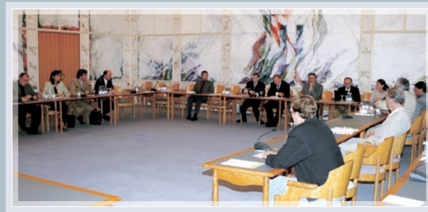
Europaausschuss des Landtages

Der Österreich-Konvent hat die Aufgabe bis Jahresende 2004 Vorschläge für eine neue österreichische Verfassung vorzulegen. Die Erhaltung der