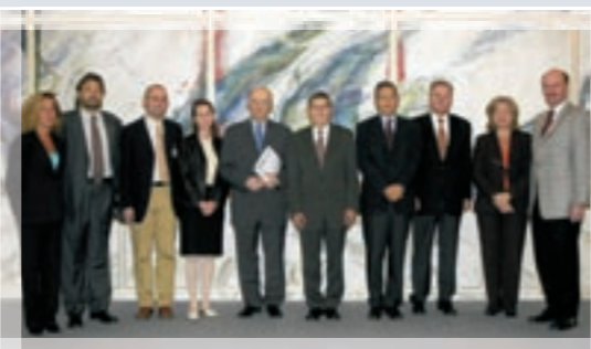
Netzwerke schaffen mit Katalonien