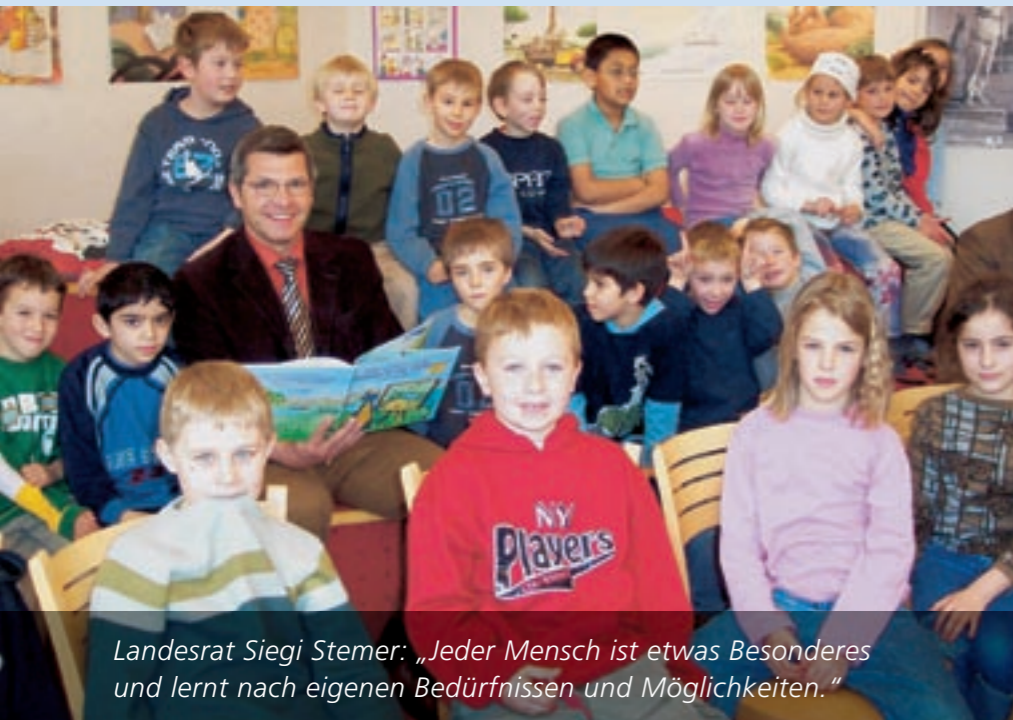
Landesrat Siegi Stemer: „Jeder Mensch ist etwas Besonderes und lernt nach eigenen Bedürfnissen und Möglichkeiten.“

In Vorarlberg ist Bildung etwas wert. Gut gebildete und ausgebildete Menschen sind der Reichtum unseres Landes und sichern auch in Zukunft die Lebensqualität. Damit die Bildungsqualität in unserem Land erhalten bleibt, tätigt das Land zusätzliche Investitionen.