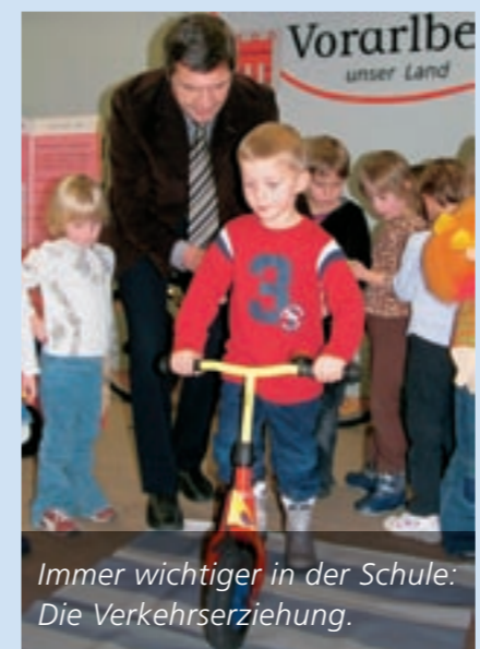
Immer wichtiger in der Schule: Die Verkehrserziehung.

Im September 2003 wurden alle vier Vorarlberger Lehrerbildungseinrichtungen im „Akademienverbund“ in Feldkirch zusammengefasst. Gemeinsam bereiten sie die Gründung der „Pädagogischen Hochschule“ im Jahr 2007 vor.