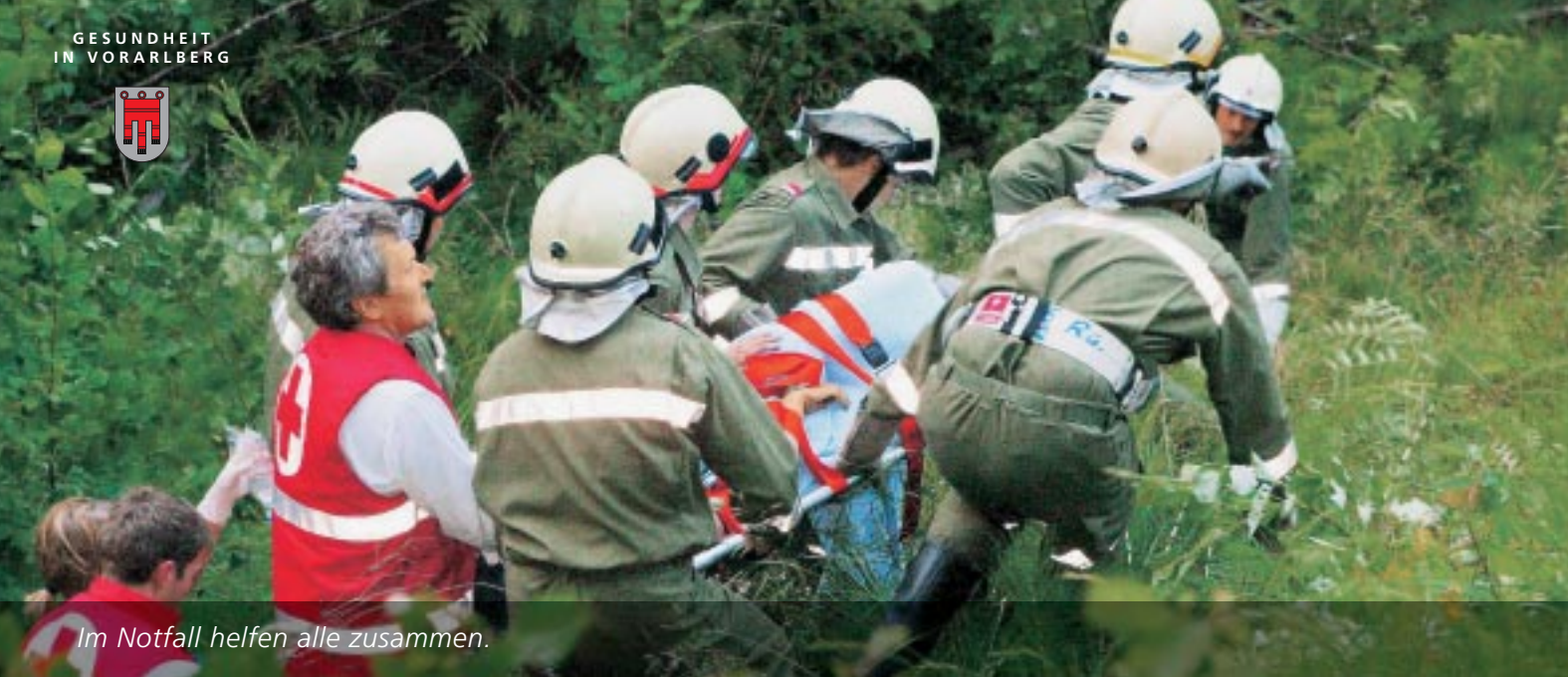
Im Notfall helfen alle zusammen.