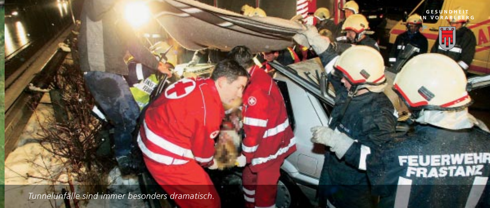
Tunnelunfälle sind immer besonders dramatisch.