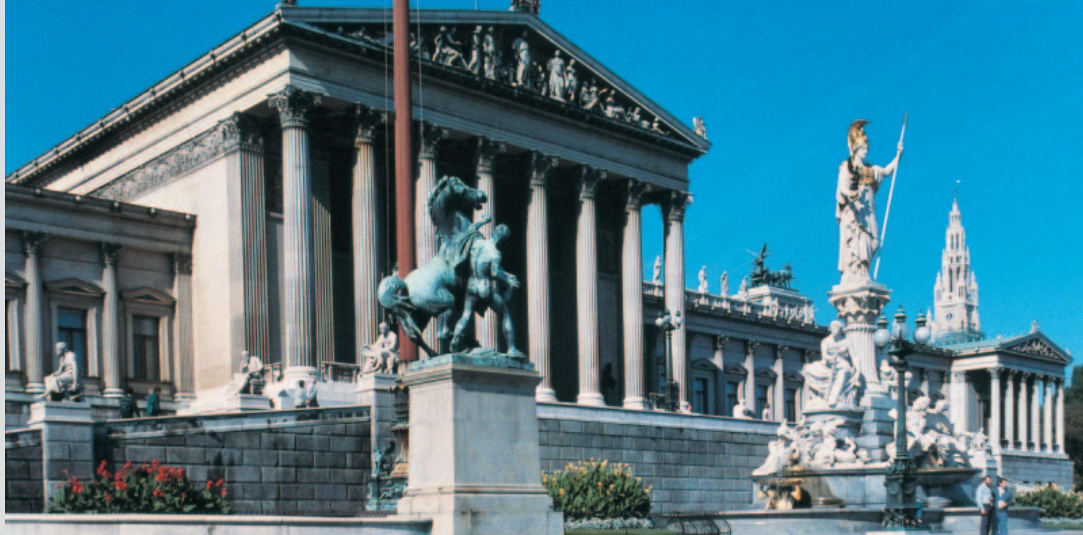
Das Parlament in Wien, Sitz des Bundesrates.

An der Gesetzgebung des Bundes sind die Länder über den Bundesrat beteiligt. Er hat dabei in erster Linie die Aufgabe, ihre bundesstaatlichen Interessen zu wahren. Deshalb wird er auch als die Länderkammer des Parlaments bezeichnet. Als Ausdruck dieser besonderen Aufgabenstellung werden die 62 Mitglieder des Bundesrates nicht wie die Nationalräte vom Volk gewählt, sondern von den Landtagen für die Dauer ihrer Gesetzgebungsperiode entsandt.