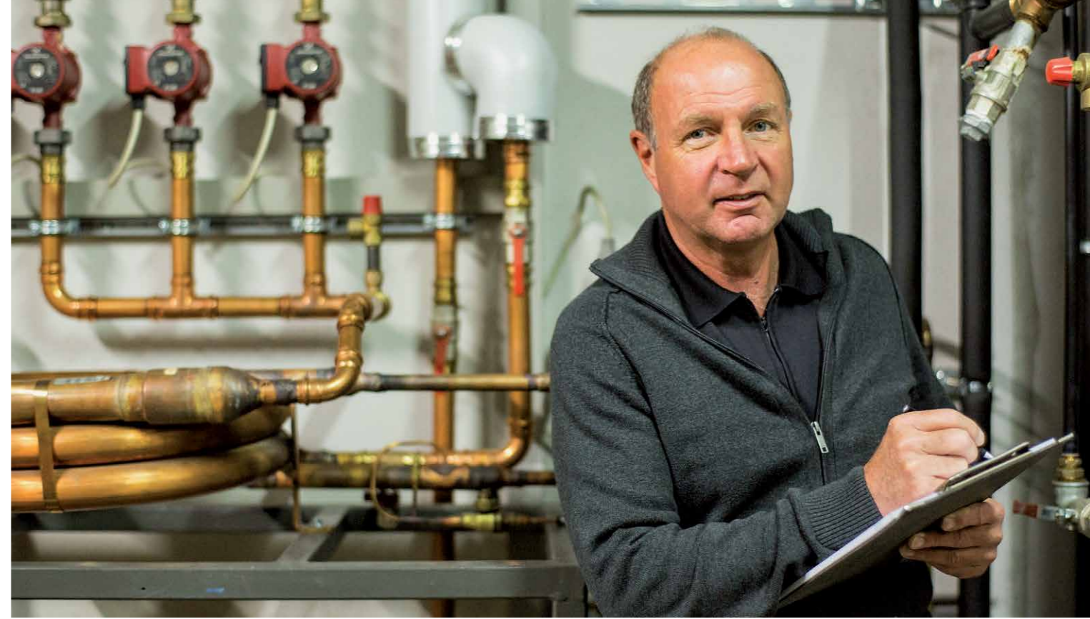
Der Anlage zur Wärmerückgewinnung liegt ein ausgeklügeltes Steuerungs- und Pumpensystem zugrunde.