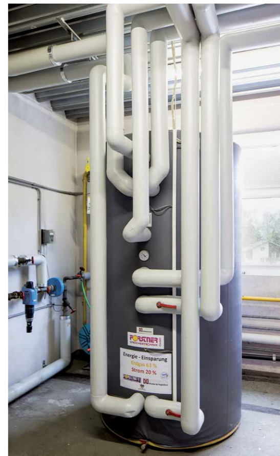
Für die intelligente Speichertechnik zeigt sich die Firma Forstner Speichertechnik aus Hard verantwortlich.

Die dadurch erzielten Energieeinsparungen übertrafen die Annahmen der Projektbetreiber bei weitem. Der Gasverbrauch von ursprünglich 10.200 m 3 pro Jahre konnte auf 3.700 m 3 pro Jahr reduziert werden. Das entspricht einer Einsparung von 63 Prozent. Positiv auch die Entwicklung beim Strombedarf: Der Verbrauch konnte von 153.500 kWh pro Jahr auf 129.400 kWh pro Jahr gesenkt werden – eine Einsparung von 16 Prozent. Effizienzmaßnahmen, in die der Vorarlberger Metzgerverband insgesamt 70.000 Euro investierte. Die Betriebsdauer der Anlage wird auf ungefähr 25 bis 30 Jahre geschätzt. Im Unternehmen zeigt man sich ob den erreichten Zielen zufrieden: „Die zusätzliche Heizung wird erst unter einer Außentemperatur von 1 bis 2 Grad benötigt. Bis dahin reicht die Energie aus der Abwärme“, freut sich Geschäftsführer Wolfgang Ochsenreiter.