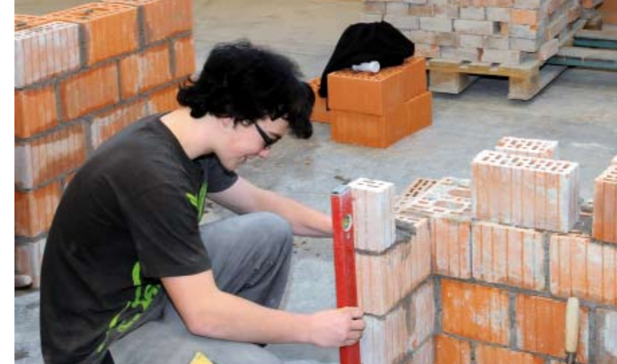
An Vorarlbergs Landesberufsschulen werden über 7.400 junge Menschen ausgebildet.

Die Berufsreifeprüfung ermöglicht das Studium an Fachhochschulen und Universitäten. Seit 1997 haben schon von mehr als 1.000 Personen in Vorarlberg die Berufsreifeprüfung erfolgreich ab-