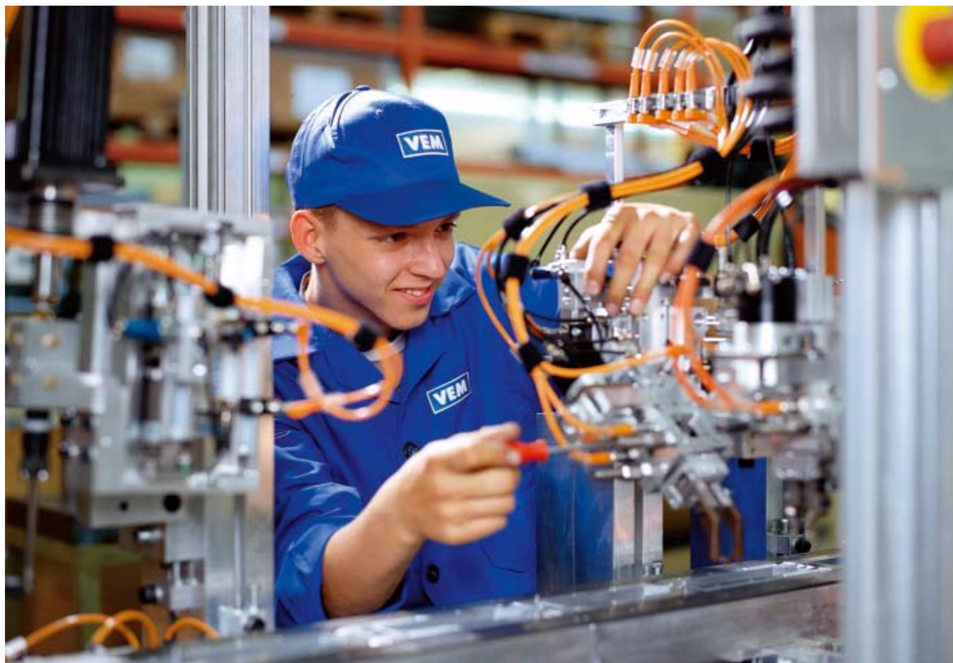
Rund 2.300 Vorarlberger Betriebe bilden Lehrlinge aus.

Eltern, Betriebe und Jugendliche schätzen die duale Lehrlingsausbildung als besonders praxisorientiertes Modell. Durch die große Bandbreite an Qualifikationsmöglichkeiten – von der Integrativen Berufsausbildung (Teilqualifizierung) bis zu High-Tech-Berufen und zur Vorbereitung auf die Berufsreifeprüfung – können viele Chancen am Arbeitsmarkt genutzt werden.